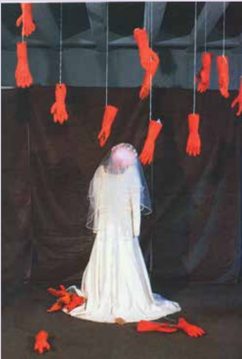
Her Genç Kızın Rüyası

Evliliğin kadına yüklediği işler, sorumluluklar hiç konu edilmezdi. Hele evlilikte kadının şiddet görebileceğinin lafı bile olmazdı.