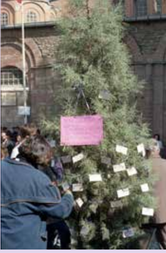
Feminist Dilek Ağacı