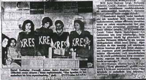
"Her işyerinde ve mahallede kres istiyoruz," Halk Haber Ajansı , 1970'ler. Kadın Eserleri Kütüphanesi ve Bilgi Merkezi Vakfı, Kadın Örgütleri ve Örgütlenmeleri, İlerici Kadınlar Derneği Arşivi

"Her işyerinde ve mahallede kres istiyoruz" ADANA, (Ada-K) Ada İKD'leri, "Devlet Kızılayı" ile bir araya gelerek, kres kampanyasının 8'inci yıldönümü hatıra dağıttılar. Kres kampanyasının bu yıl sonunda büyük bir başarıyla sonuçlandı. İKD'ler mahallede kres ve yurt kampanyalarını büyük bir ilgiyle sürdürüyor. İlerici Kadınlar Derneği Adana Şubesi'nin 4 bin 500 yakın kadını kapsayan Türkiye Boyuk Millet Meydanı'na gönderdiği "Yurt" posterini kampanyasının 8'inci yıldönümü hatıra dağıtımında kullanmıştı. Çocuklarına kres istiyoruz kampanyasının 8'inci yıldönümü hatıra dağıtımında kullanmıştı. "Her işyerinde ve mahallede kres istiyoruz."