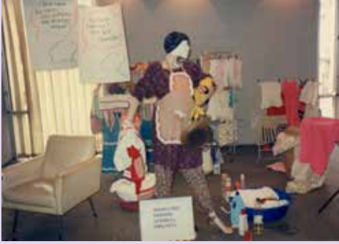
Pazar Günü Kadının Düşünsel Faaliyeti

Bu eserleri düşünüp yaratma işini de bu etkinliği düzenleyen tüm arkadaşlar üstlendi ve tüm eserler, yine yoğun bir imceyle gerçekleştirildi. Arkadaşlar sadece çalışmakla kalmadı, eserleri gerçekleştirebilmek için gerekli tüm malzemeyi de bulup getirdiler. Vitrin mankenlerini Kasımpaşa'daki manken kiralama mağazalarından bir haftalığına ücretsiz kiralamayı becerdiler. Kendi gelinliğini, anneannesinin konsolunu, annesinin işlemeli mutfak önlüğünü getirenler oldu. Eserlerde gözükten tencere tavadan çocuk beşiği ve biberonuna, cımbız, tampon, ped, sutyen ve çamaşır leğenine her şey kadınların sürekli kullandığı nesnelere ve evlerden getirilmişti.