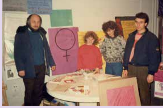
Radikal Yeşil Hareket'in standı, 1987