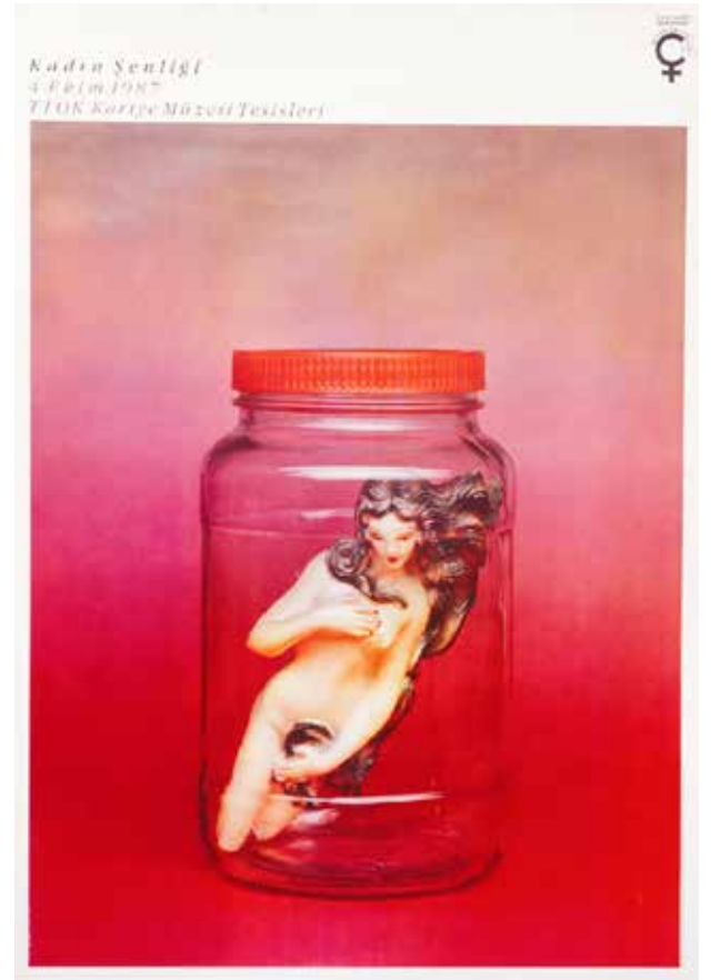
Afişte yer alan Kavanozda Venüs adlı eser Gülsün Karamustafa'ya ait. Grafik tasarım: Sertaç Ergin.

Afiş hâlâ bu tartışmaya açık. Bugün hakkında ne düşünülebileceğini bilmek çok isterdim.