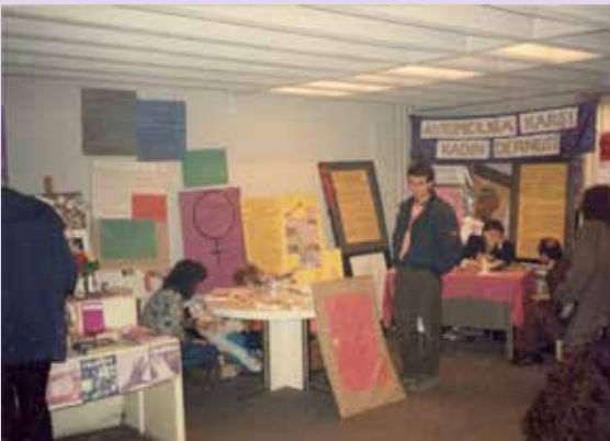
Ayrımcılığa Karşı Kadın Derneği'nin standı