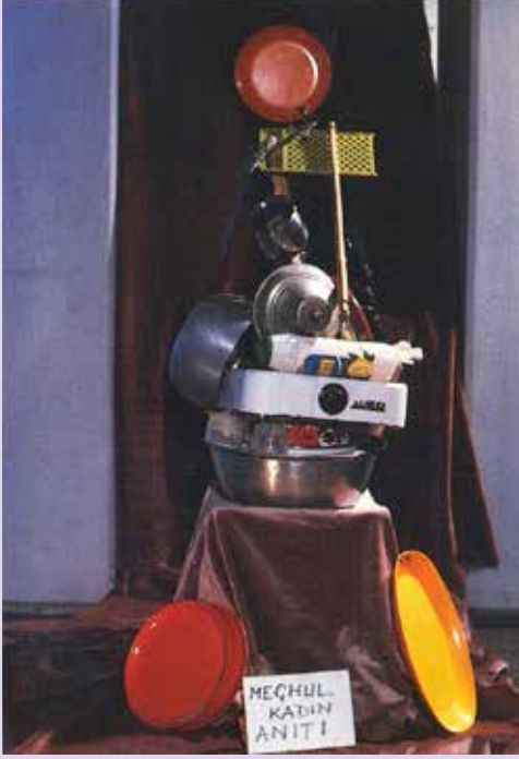
Meçhul Kadın Anıtı

Yazıda kullandığım fotoğrafları, bildiğim kadarıyla Füsun Ertuğ Yaraş, İbrahim Eren ve Enis Rıza Sakızlı çekti. Fotoğrafların bir bölümü "Kadın Eserleri Kütüphanesi ve Bilgi Merkezi Vakfı"nın arşivinde bulunmaktadır.