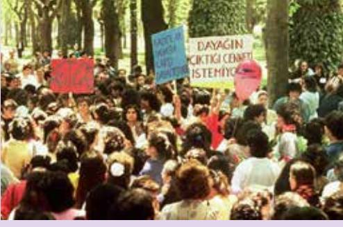
Dayağa Karşı Kadın Yürüyüşü, 17 Mayıs 1987

Böylece 1980 DARBESİ SONRASI, KAMUSAL ALANDA İLK İZİNLI KİTLESEL EYLEMİ, 17 MAYIS 1987'DE KADINLAR GERÇEKLEŞTİRDİ. BU YÜRÜYÜŞ VE MİTINGE KADIN KATILIMI HEYECAN VERİCİ SAYIDA OLDU.