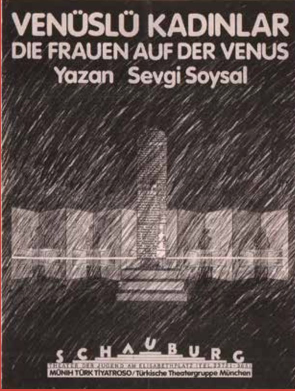
Münih Türk Tiyatrosu'nda 1983 yılında Erman Okay tarafından sahneye konan Venüslü Kadınlar 'ın afişi